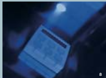
3 Außenansicht der Klimakammer mit Prototyp eines Tores