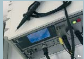
6 Glühfadentest mit Blinker „MoonLight“