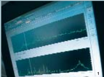
1 Test in der akustischen Kammer. Grafischeauswertung und Dokumentation des Tests an einem externen PC