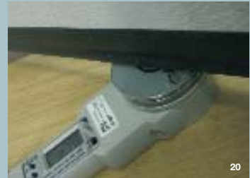
20 Aufschlagtest eines Sektionaltors

Der Aufschlagtest ist einer der Tests die im Nice-Labor vorgenommen werden, um das Kraftbegrenzungssystem zu prüfen.