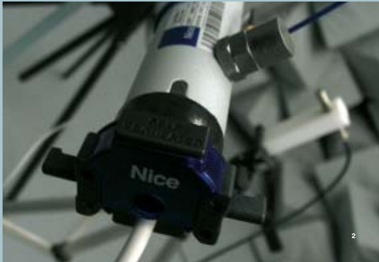
2 Test der von einem Rohrmotor erzeugten Vibrationen in der akustischen Kammer